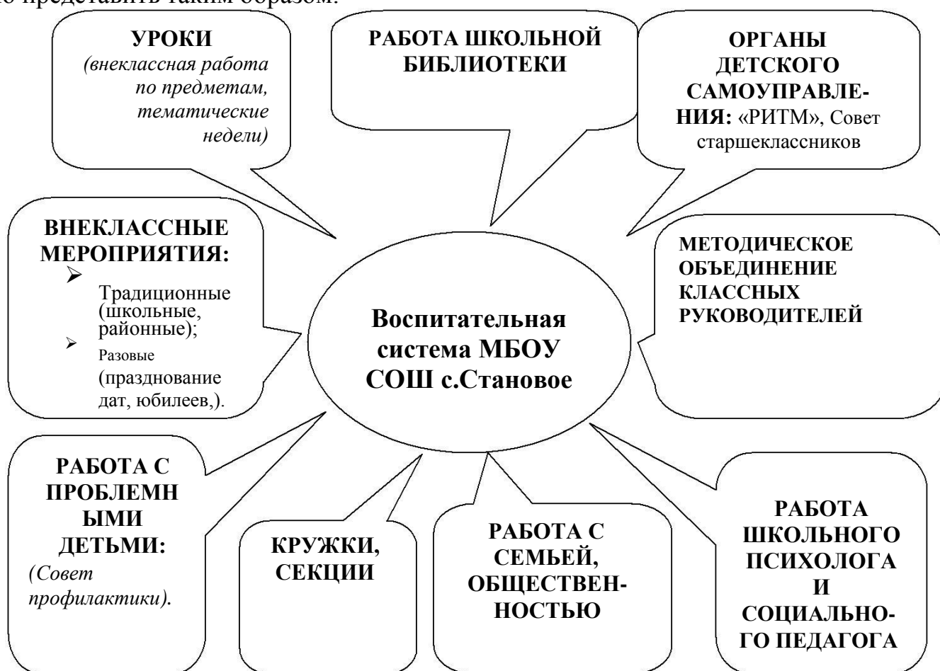
Модель выпускника МБОУ СОШ с.Становое

Мы работаем над созданием воспитательной системы школы, способной воспитывать и развивать ребенка в единстве урочной, внеурочной и внеклассной деятельности. На сегодняшний день воспитательную систему школы схематично можно представить таким образом: